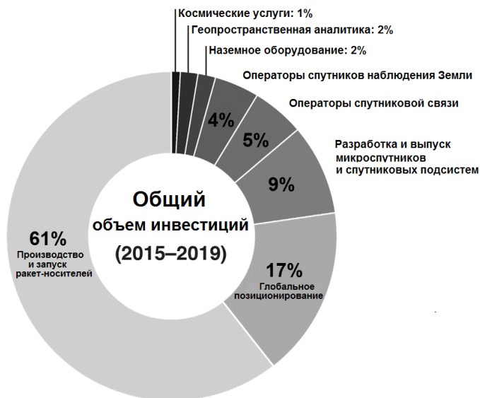
Рисунок 2. Структура инвестиций в китайские космические стартап-предприятия по видам специализации.

Galaxy Space — в ноябре 2020 года завершила новый раунд сбора средств, точный объём привлечённых средств не разглашается, но компания сделала заявление, что по результатам раунда общая рыночная капитализация Galaxy Space достигает 8 милли-