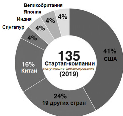
Рисунок 1. Соотношение стран по количеству космических стартап-компаний, получающих финансирование, объёму инвестиций, количеству заключённых сделок и участвующих в них инвесторов.

тап-предприятия по видам специализации демонстрирует, что основным потоком привлечённых с 2015 по 2019 год средств (61%) аккумулируется компаниями в области разработки, производства и запуска ракет-носителей и многоразовых двигателей, далее следует сектор, связанный с оказанием услуг глобального позиционирования (17%), и производственные компании, специализирующиеся на разработке и выпуске микроспутников и спутниковых подсистем (9%) (рисунок 2).